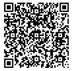
動画配信はこちらから

受けている町内事業者への支援や観光サービス事業者の需要回復と、地域のにぎわいを図る支援を新年度予算に盛り込んでいる。