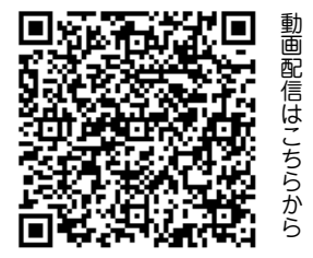
動画配信はこちらから