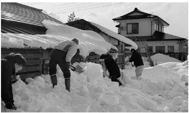
▲ボランティアによる除雪作業

協議会、相談支援センターなど関係機関が連携し、取り組みの流れを「見える化」した情報共有と課題整理を進める。