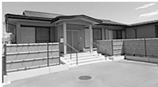
▲整備が進む民泊施設

③第4次観光振興計画の見直しの中で、宿泊施設という民泊事業に力を入れ、民間で整備が進んでいる。観光による町内消費を喚起する施策が必要である。