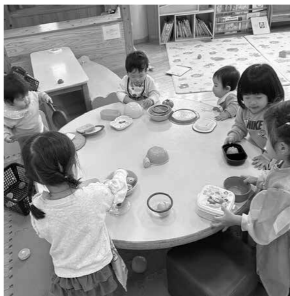
▲おままごと楽しいね

問 令和6年の合計特 殊出生率は1・15と過 去最低で、当町で生ま れた子どもも約90人と 激減している。 結婚促進のため、コ ミュニティーの機会を 後押しし、家賃助成制 度などの支援策は考え られないか。