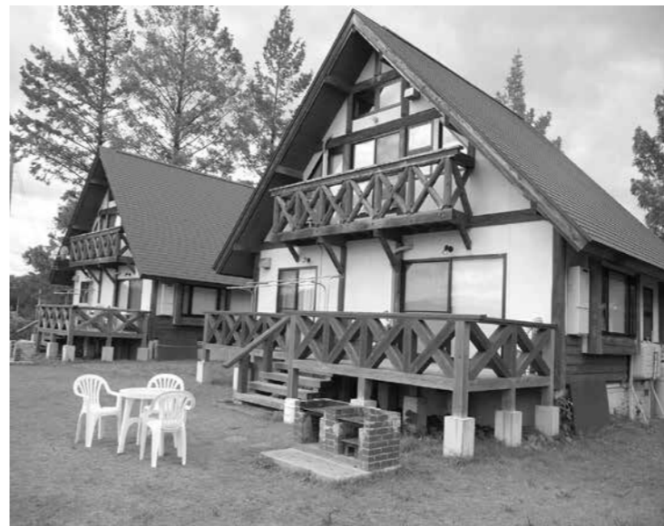
▲ログハウスが人気の「ゆうきの里さんさん」