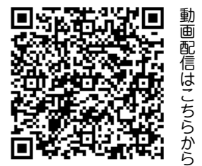
動画配信はこちらから