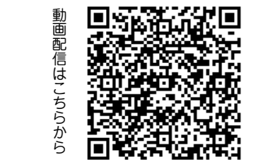
動画配信はこちらから

問 自主財源の増加に向けた体制、組織の構築は重要な課題である 答 自主財源の増加に向けた体制、組織の構築は重要な課題である