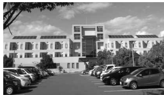
▲地域医療を支える高島病院

6月以降は新たな 点数算定が開始され るが、その配分や実 質的な経営改善効果 については不透明で あり、今後の動向を 注視する必要がある。 また、物価高騰への 対応として、町によ る追加支援と国の支 援金を合わせた総合 的な支援が求められる 。今後の地域医療