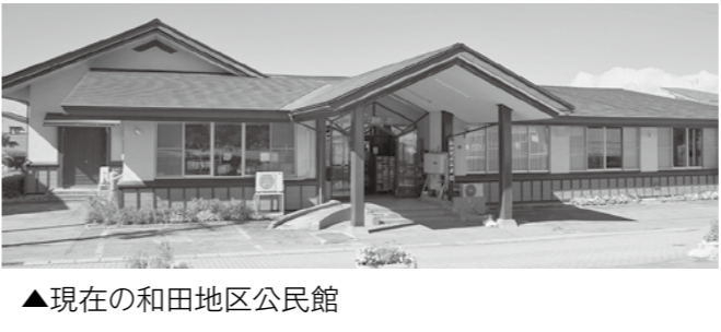
▲現在の和田地区公民館

一般会計 和田地区公民館改築 2億6008万円 老朽化した和田地区公民館の改築工事を行い、地域の学習・交流活動の拠点機能を確保する。整備に当たっては町産木材を活用し、地域資源の循環と木材利用の促進を図る。あわせて、多世代が集える環境整備を進める。