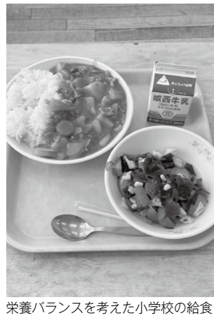
栄養バランスを考えた小学校の給食

1億2665万円 小中学生の学校給食費が全員無償に 令和7年度は「学校給食費支援事業」を実施し、町独自の取り組みとして「第3子以降の学校給食費無償化」を行ってきた。8年度は、学校給食費の負担軽減と食材価格高騰への対応を図るため、「学校給食負担軽減事業」を実施する。保護者の家計負担の軽減を図りつつ、子どもたちに安全で安定した給食を継続して提供することを目的に、給食費への支援を行う。 財源は、県の「学校給食費負担軽減交付金」および国の「重点支援地方創生臨時交付金」を活用する。 8年度 の一人当たりの給食費の単価はいくらか。 8年度 は一時的な国の交付金の活用をして無償化を実現できたが、もし9年度以降に交付金がなくなった場合でも、給食費の徴収を再開する意思はないとの考えか。