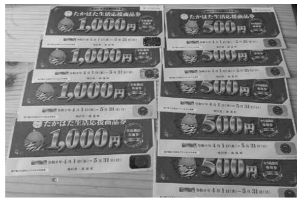
▲ご使用は5月末までに

問 国の臨時交付金全体を、概ね生活者支援に2分の1、事業者支援に2分の1と割り振ったため、生活者支援の商品券として1人当たり7千円となった。