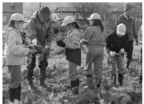
▲学校農園で野菜の収穫