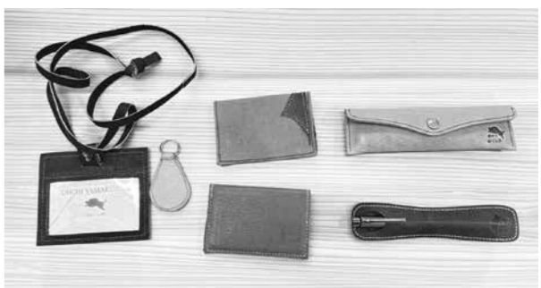
▲有害鳥獣を活用した革製品

美郷バレー構想とは、イノシシやシカ等の獣害対策に関するあらゆる情報、技術、人材が集まり、新たな交流や研究、ビジネスといった地域課題解決型のカタチが生まれる拠点づくりである。 これは単に捕獲ではなく、獣害を「負の遺産」と「行政の駆除」を切り分け、農家自身が無許可を取得し、「自分の農地は、自分が守る」という当事者意識を醸成したことから始まる。町を丸ごと実証実験の場として民間に提供し、企業が実費を投じて参画したくなる環境整備も参考にしたい。