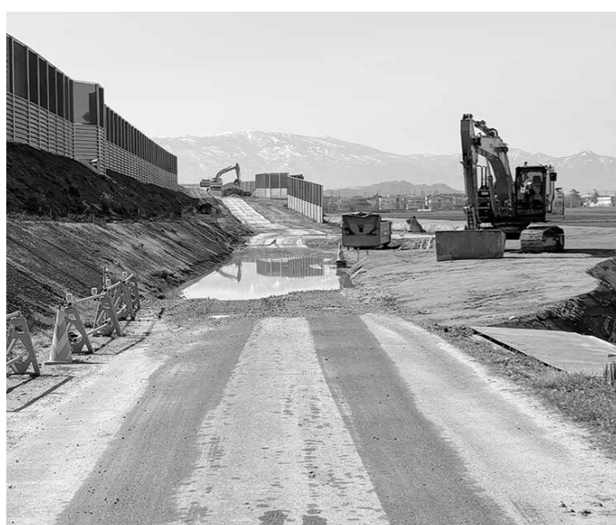
▲スマートIC西側工事の様子

8年度に向け、災害時に屋内で使用する簡易テントや間仕切り、簡易ベッド、屋外で使用するテントや収納倉庫購入に使用し、糠野目小学校、高島中学校に配備する予定となっている。