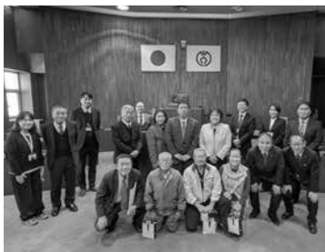
▲元氣な世話焼き隊の方々