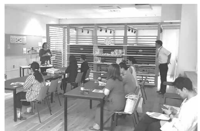
▲女性活躍を期待した学びの場「創業応援セミナー」

町では「リーダー経営人財育成塾」を開講し、これまで4期にわたり、合計22人の卒業生を輩出し、地域経済の牽引役だけでなく、将来のまちづくりの担