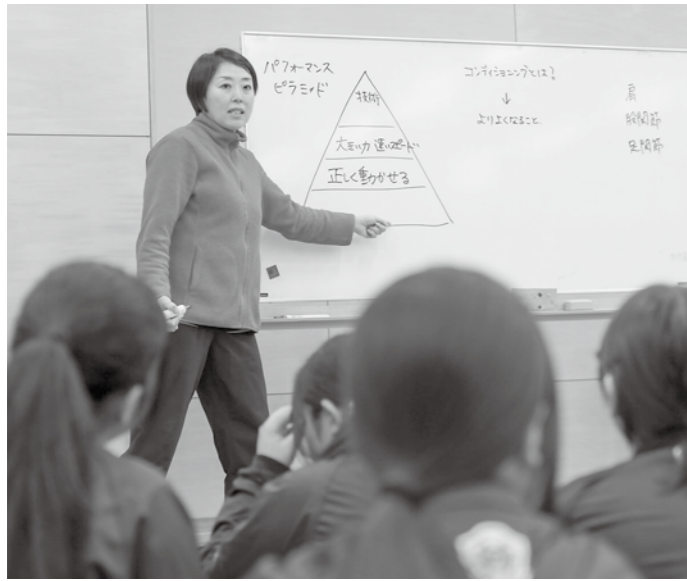
▲外部講師による「まなびの場」の授業光景