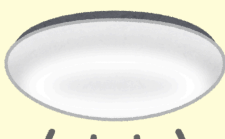
LED照明器具 (目標年度2020年度)

省エネ基準達成率100%以上または、統一省エネラベルの多段階評価点4.0以上の製品