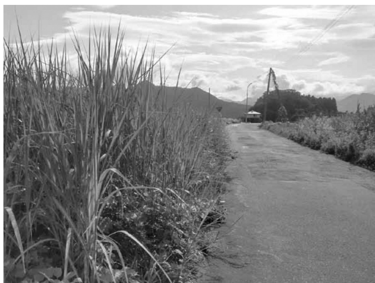
▲伸びきる前に草刈りを

○ 防災マップの浸水想定は、最上川、屋代川、天王川、砂川、鬼面川および吉野川の外水氾濫想定である。「色付けされていない区域は浸水しない」との誤認のないよう、防災マップの表記を改めてはどうか。