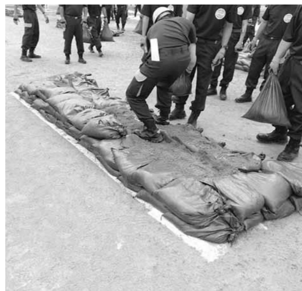
▲災害から地域を守る消防団

○ 町では、令和5年度の団員数が625名となっており、年々減少傾向にある。団員が、入団しやすい、活動しやすい環境の整備を検討する必要があると思うがどうか。