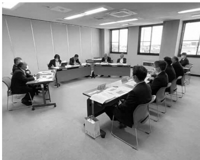
危険空き家対策について熱い議論をかわす (秋田県 三種町)

調査目的 空き家が年々増加、老朽化し、廃屋になり倒壊の恐れや環境の悪化を招いている。このような対策として、特定空き家としての公表や命令・戒告・代執行などの法的措置がある。こうした法的措置は、長期間を要し債務者