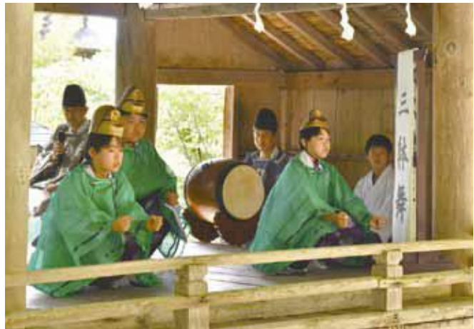
▲「延年の舞」を舞う小学生男子 ～興味のある子どもさんは、安久津八幡神社へ～

町民の皆さんにも、このような伝統芸能が高島町にも受け継がれていることを知っていただき、今年の秋の例大祭にはぜひご鑑賞いただきたいと思います。