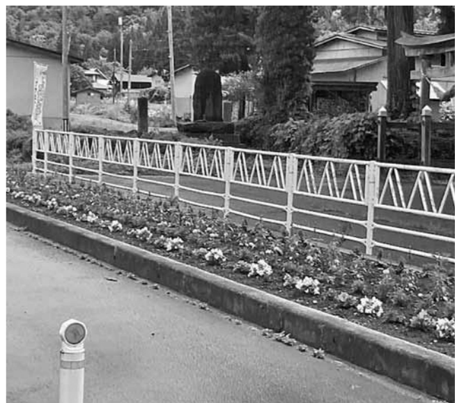
地域を明るく彩る「花いっぱい運動」

今年度予算の追加工事は、別途発注する。供用開始時期は国交省から公表されていないため、未定である。