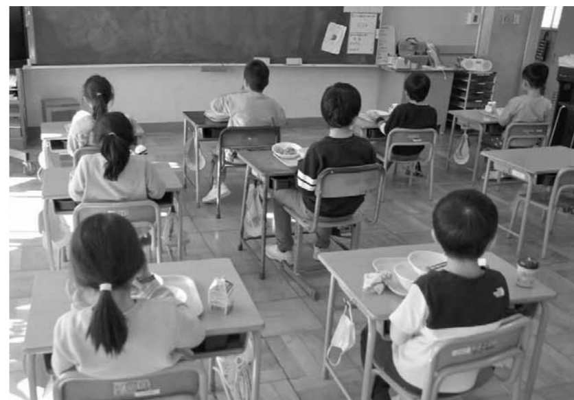
▲高島の有機米を学校給食に