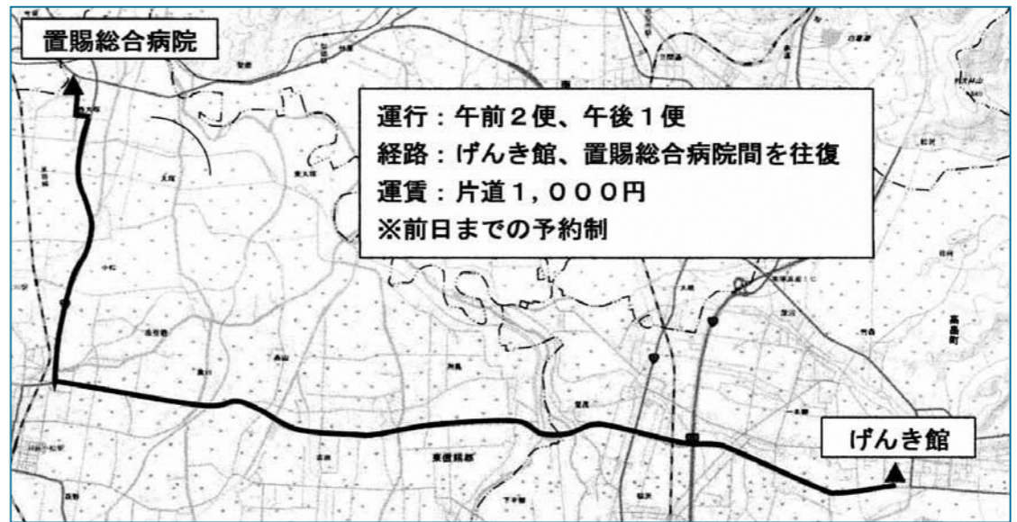
▲デマンドタクシー運行経路

置賜総合病院以外の運行予定は。米沢市立病院も候補であるが、実証実験の結果等によって総合的に判断する。