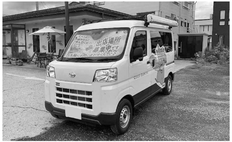
▲キッチンカー導入支援へ