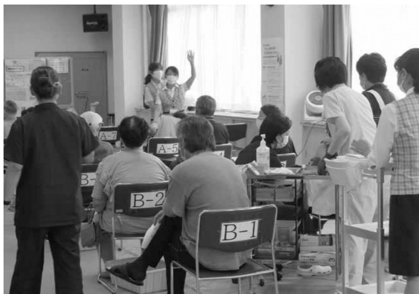
▲コロナワクチン接種会場（げんき館）

問 高齢で重症化リスクの非常に高い方については、公立置賜総合病院、米沢市立病院等の感染症指定病院を中心に対応することになっている。 問 新型コロナウイルス感染症対策に関し、県の要望があればその内容は。 答 社会経済の多方面に影響を与えている。今のところ特別な要望事案は持っていないが、経済対策に関する事など機会を捉えて要望する。 問 今後ウィズコロナ社会にどのように対応すべきか。 答 法律に基づき行政が要請や関与する仕組み