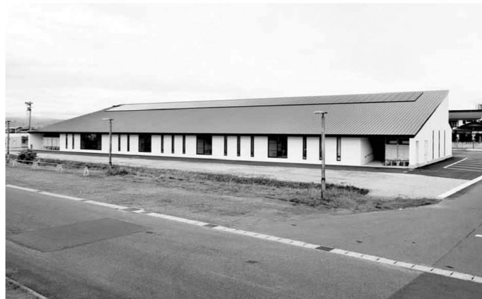
▲ゼロカーボン実現のために太陽光発電導入(図書館)

答 第3次計画は、立案過程での町民参加や温暖化の急速な進行状況、町の未来を実現するための具体的な取り組みが示されている。一見、総花的とも読み取れるが、第3次計画で特に力点を置く施策は何か。