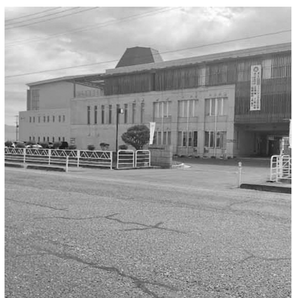
▲入学者の減少が著しい高島高校

○ 高島高校はまだ、県立高等学校の再編計画には現れてはいないが、受験者数の減少は今後再編が検討される場合、大変厳しい状況を招くと考える。高校の同窓会と一緒に、存続に向けた取り組みを進める。