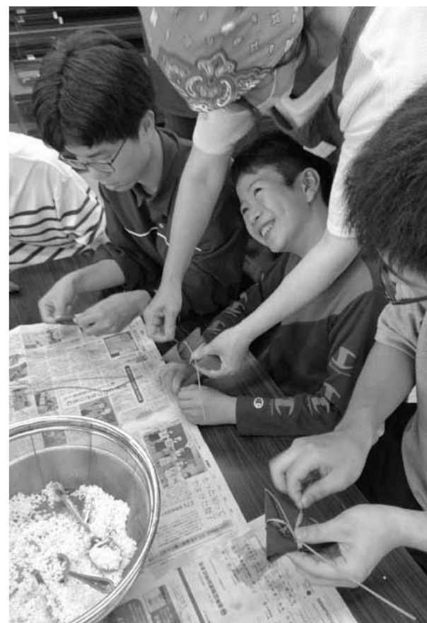
▲先人の知恵ってすごいなあ ～フィールドワーク～ (二井宿地区 笹まきづくり)

う方針とのことだが、二井宿地区との関わりをどのように考えているか。 また、地域の声を反映したものを整備する計画はあるのか。