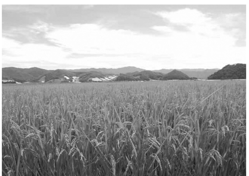
▲未来に引き継ぎたい田園風景

◆日本と高島の農業の危機的な状況を打開し、農家の生活と経営を守るための請願 採択/不採択の意見が分かれたため、本会議で討論、採決の結果、多数決により不採択と決した。