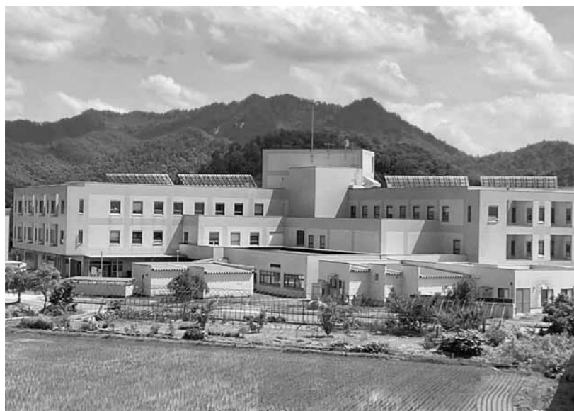
▲以前と同様の体制で安心して受診できるように（高島病院）

問 コロナ感染症法の位置付けが5類に変更された。感染の拡大が見えにくく、検査費用や医療費が自己負担になるなど、潜在的な感染者が増えて重症化も心配されるが、町はどう見ているのか。 答 現段階で、今後の感染状況を予測することは困難であるが、身近な感染状況を把握することが以前よりも難しくなってきた。町としては、国の動向を注視し、県や置賜保健所等と密に連携を図りながら、感染状況に合わせ、適時適切な対応に努めていかねばならないと考えている。