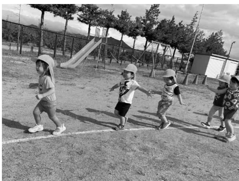
▲子どもたちの健やかな成長には保育士の寄り添いが大切

イドラインを示したが、子どもの心身に有害な影響を与えないためには、問題として捉える共通認識が必要では。 民間施設に対しても、保育の実施主体である町として、役割をどう果たしていく考えか。 答 今回の調査の中で、保育現場では相当な不安を抱えていることも