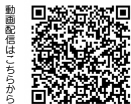
動画配信はこちらから