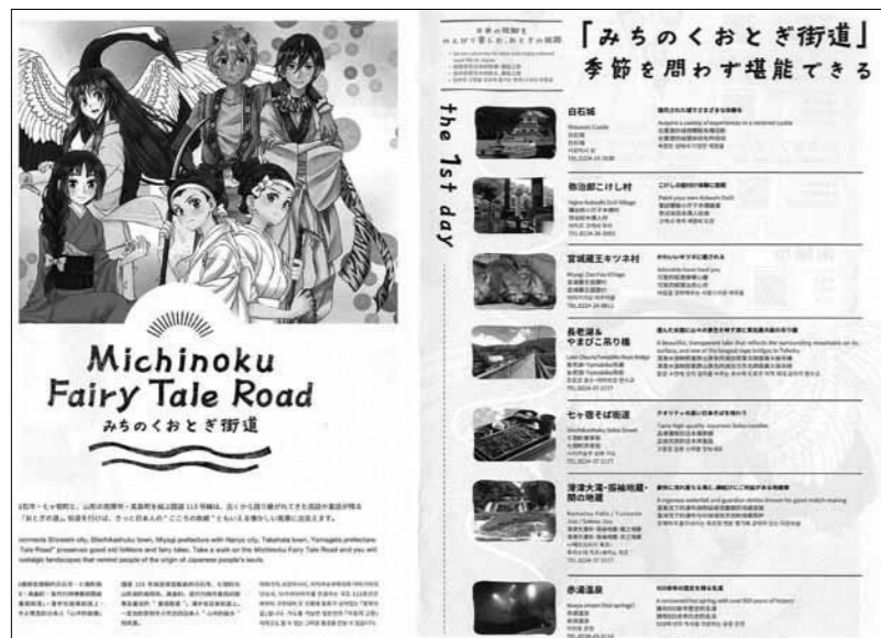
▲インバウンド推進のための多言語パンフレット

らせるべきと考えるがどうか。 答 本町は、福島第一原発の処理水に関する一連の取り組みについて、安全性の科学的根拠を示す立場にはない。処理水の海洋放出については、国が政治的に国内外を問わず、対応すべき案件と考えている。 インバウンドを積極的に 問 訪日観光客が増えてきており、地方にも来ている。この機を逃さず積極的に、外国からの旅行者を迎える作戦を町と民間で協議会を組織して、具体化し実行してはどうか。 答 町の農産物や童話・民話を活かして誘客するのはどうか。 問 町の観光事業者をはじめ山形県や置賜インバウンド推進協議会による広域での観光誘