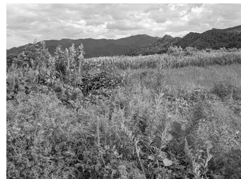
▲地域全体で解決が望まれる耕作放棄地

答 間口除雪への対応については、除雪委託業者の体制や、受け持つ路線規模と完了目標時間などの関係から課題は多い。 「雪の塊を置いていかない」などの対応について、今後委託業者と意見交換の場を設け検討を行う。