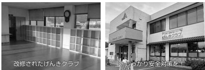
改修されたげんきクラブ