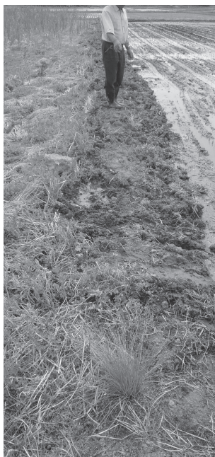
▲イノシシによる被害箇所

○ 本年度はイノシシの捕獲頭数が激増し、埋設処分に苦慮していることは認識している。焼却処分施設の設置については、高島町だけの問題でないことから、今後、置賜3市5町で協議していきたい。