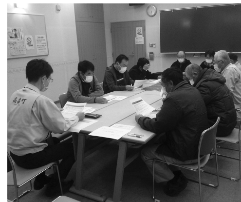
▲人・農地プランの座談会で

24年から取り組み、地域農業における高齢化や後継者不足、耕作放棄地の増加等を解決するため集落ぐるみで考えていくためのプラン作りである。これまでの実績と地域の課題解決状況はどうか。