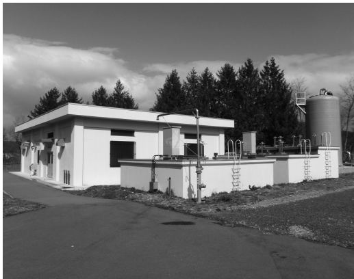
▲高島町第一水源地（金原湯在家）

本制度は、生活保護世帯など、成年後見人に対する支払いが困難な世帯を支援するもので、その利用者が増加しているためである。