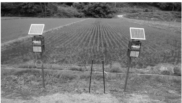
▲導入が予定されている広域侵入防止柵

答 コロナ禍の中でも大幅な減収を余儀なくされている町内宿泊業や飲食業にとって大変期待の大きい取り組みと考える。今後、町商工会を通じて、旅館組合や料理飲食振興会で検討されるよう働きかける。