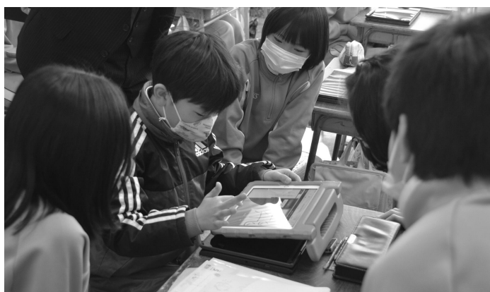
▲タブレットを使った小学校での授業風景

☑ 令和3年度は、ICT活用の日常化を図り、授業実践を多く積み上げていく。令和4年度からは、ドリル学習や宿題など、家庭への持ち帰りの本格実施を進めたい。