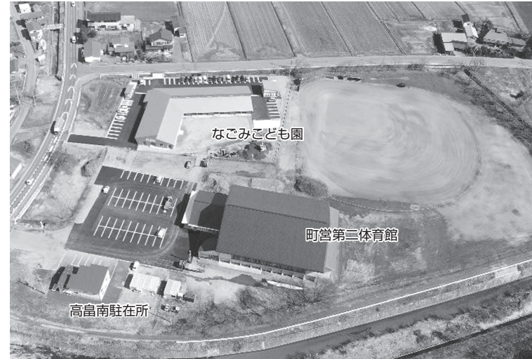
▲整備された町営第二体育館 なごみこども園 (旧第三中学校跡地)

3月定例会を16日間および臨時会(2月5日)を開催し、専決処分の承認、人事案件、令和2年度補正予算、令和3年度当初予算、条例の改正、総合整備計画など計46件について審査し、原案どおり可決した。 また9名の議員が一般質問を行い活発な議論を展開した。請願については、2件のうち1件が採択、1件が不採択となった。