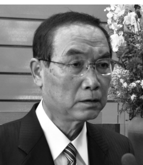
島津 正幸 議員

☑ イノシシをはじめとする「有害鳥獣対策」や、農業従事者の高齢化が進行していることから「次代を担う農業後継者の育成」をまた、健康や食生活に対する関心の高まりから「地産地消と食農教育の推進」などに力を入れていく。