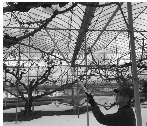
▲支援が急がれる農業設備

遊休農地は原野化しつつある。これ以上遊休農地を増やさないためにも、兼業農家や経営面積が2〜3ヘクタールの小規模農家に乗用草刈り機、電動バ