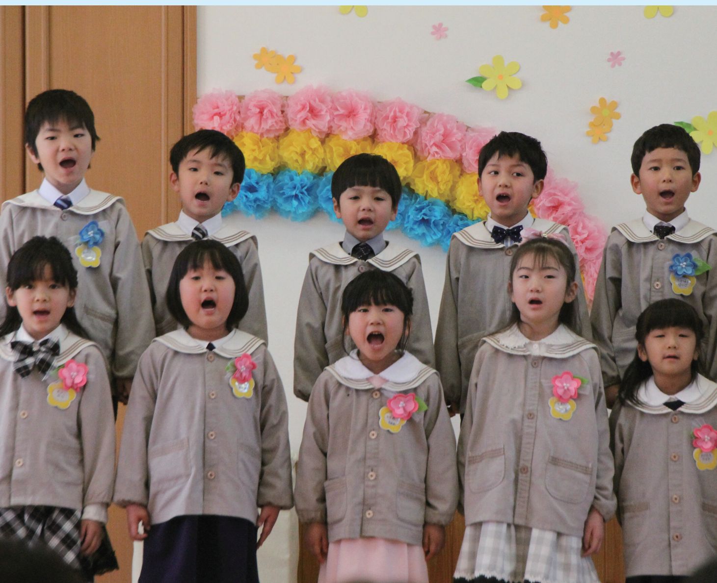
▲みんな友だち ずっとずっと友だち（なかよしこども園卒園式）