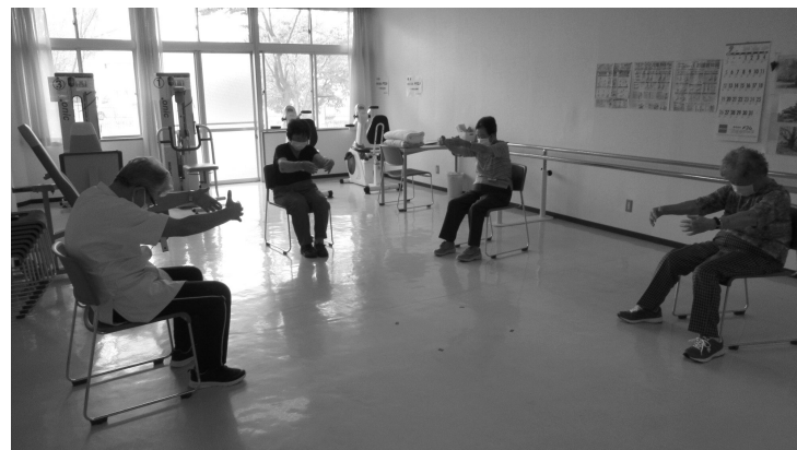
▲介護予防のための高齢者体操

答 計画によるさまざまな介護予防事業などを実施してきた。特に地域ケア個別会議では、多種の専門職による医療と介護の観点から助言し、利用者への適切なサービスを提供した結果、要介護認定者数の減少につながった。