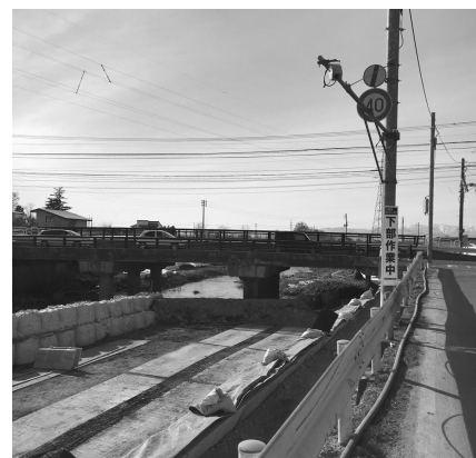
▲早期の架け替えが切望される津久茂橋

これまで、国や県から河道掘削や堤防かさ上げ等の防災・減災対策を実施いただいた。今後は、課題である架け替えの実現に向けて地元同盟会と連携し、引き続き要望していく。