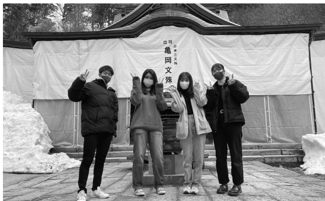
▲若者が地元で就職し定住できる支援が求められる