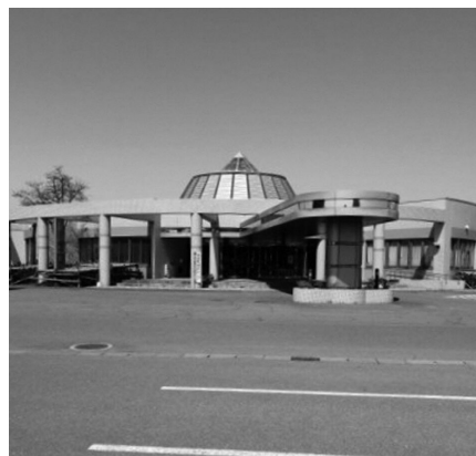
▲集団接種会場となる げんき館

クチンは、特殊な保管庫を必要とするため、会場を限定した集団接種とせざるを得ない。他社製ワクチンが承認されれば、かかりつけ医での接種も検討する。職場での接種については国で検討中であり、動向を注視している。