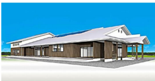
【新和田地区 公民館 外観図 イメージ】