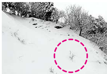
▲⑤平地に見える斜面