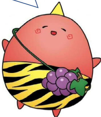
高畠町公式マスコットキャラクター「たかつき」