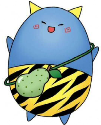
高畠町公式マスコットキャラクター「はたつき」