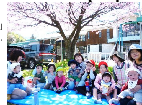
桜の木の下でおやつタイム