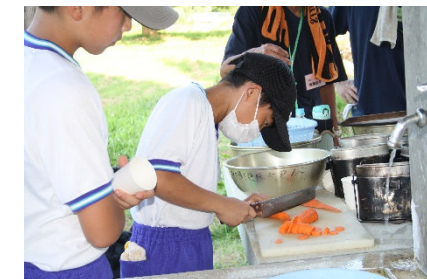
ゆっくり、ゆっくり、気をつけて