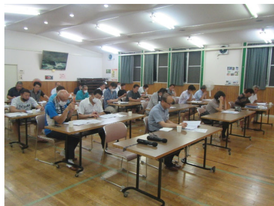
実行委員会(7月27日)の様子

今年度の地区めぐり早朝ウォーキング大会は、9月3日(日)早朝に行われます。開催内容、コースについては、裏面の開催案内をご覧ください。是非、ご家族そろってのご参加をお待ちしています。