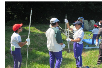
最初の活動は、テント張り

ご協力いただいた子ども会育成会の役員のみなさま、指導員、カウンセラー等をボランティアで担っていただいたみなさま、準備から後片付けまで大変ありがとうございました。