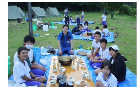
楽しい、夕食のひととき