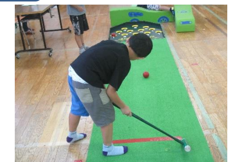
9月7日（水） スポーツ教室