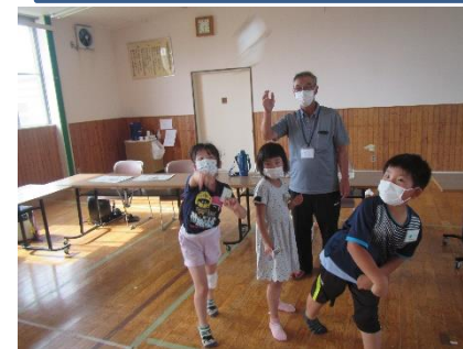
6月29日（水） 紙ヒコーキとばし