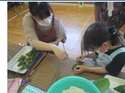
7月2日（土） 笹巻きづくり