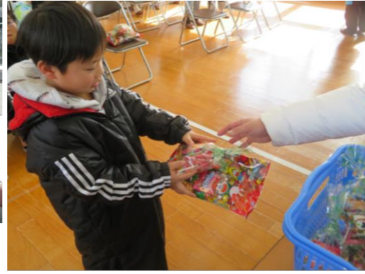
空くじなし! 参加した方にもれなく景品が渡りました。