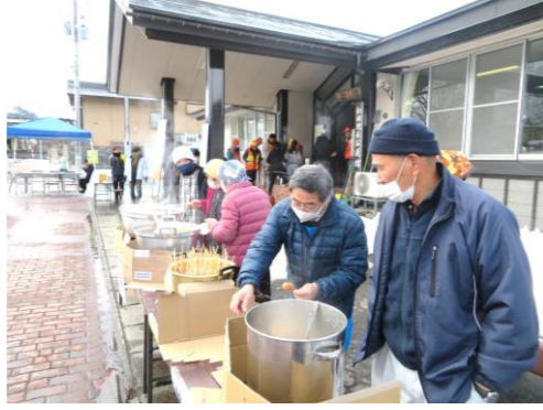
▲ 実行委員会の振る舞い ▲ 鍋2種類に加えて、今年は玉こんにゃく、甘酒と盛りだくさんでした!