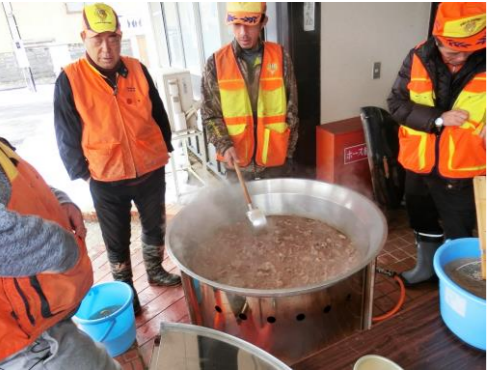
▲ 恒例の猟師鍋 ▲ 猟友会の皆さんに「ぼたん鍋」を提供していただきました。