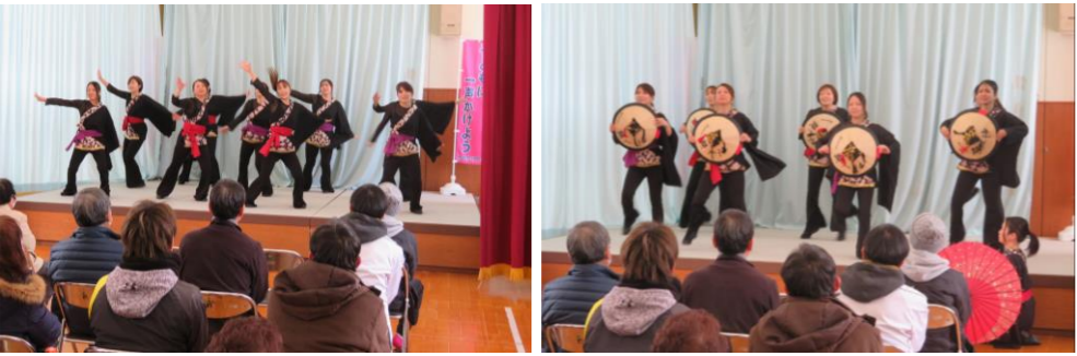
▲ 飯豊町ダンスグループ 「Team艶ya沙」のパフォーマンス ▲ オリジナルの風車やキーホルダーを作って交流しました⇒