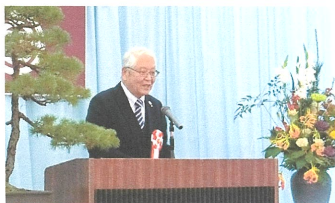
高梨忠博 町長による年頭の挨拶