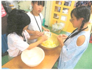
夕食づくりのお手伝い