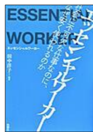
『エッセンシャルワーカー』