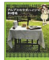
『アルプスの少女ハイジの料理帳』