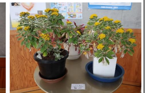
イソギク、シャコバサボテン